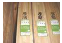
ひのきのフローリング

日本列島には、北から南まで数多くの森林が点在しています。その土地の独特の風土の中で育った樹木は、それぞれに特長があります。そんなさまざまな表情を持った国産材を集めた展示会が横浜市金沢区の木材問屋さんで開催されます。是非とも、この機会に「本物の木」のすばらしさを体感してください。