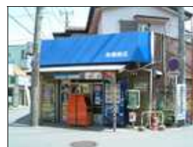
鷹取石の塀も 健在です