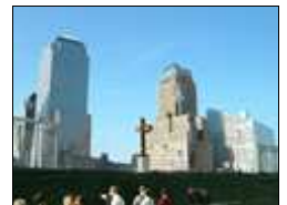
瓦礫の撤去作業が進む世界貿易センタービル跡地

昨年9月11日のアメリカ同時多発テロ事件から1年が過ぎました。グラウンド・ゼロ（爆心地）と呼ばれるニューヨークの世界貿易センタービルの跡地の瓦礫の山は撤去されましたが、ビルの基礎の補強工事が今もなお引き続き行われています。この約65,000平方メートルの跡地を巡る議論が取りざたされています。計画を統括する地元のマンハッタン公社は、「失われたオフィスの床面積を確保する」「交通の拠点にする」「住居、公園、追悼施設を設ける」といった基本計画に基づき、大手建築事務所に設計を発注した結果、6つのプランがまとまり、一般に公表しました。しかし、これとは別に新たに設計プランを追加するようです。非合法的やり方には屈しないという8割近いアメリカ人は、ツインタワーに負けない商業施設を建てて、強国アメリカを主張したいようですが、その一方で、遺族を中心とするグループは、商業施設や住居施設は一切建設せずに、モニュメントのような公園を建設し、痛ましい出来事を忘れることなく、後世に伝えたいと主張しています。