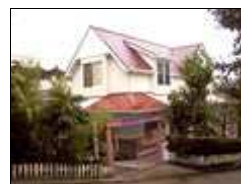
改築された新しい園舎 設計監理 a studio (ao)