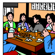
1階店内もゆったりとしています