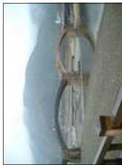
平成の架け替え中の錦帯橋

山口県岩国市には、神橋（栃木県）猿橋（山梨県）と並び、日本三名橋に数えられる錦帯橋があります。山口県最大の河川である錦川（川幅200m）に架かっている5連の木造橋で、1673（延宝元）年10月、中国の明の「西湖遊覧誌」に描かれた石橋に習い、第三代岩国藩主吉川広嘉（きっかわ・ひろよし）によって創建されました。翌年の1674（延宝2）年5月、梅雨の洪水で流失しましたが、二代目の錦帯橋が新設されてから、昭和25年まで276年もの間、不落を誇りました。その後、岩国地方を襲ったキシヤ台風で再度流失し、昭和28年1月に、三代目が新設されました。その後、橋の保全のために、昭和38年以来、5年ごとに橋の健康診断（強度試験・腐敗調査）が実施され、その度に補修工事が施されましたが、近年の老朽化が顕著となり、平成の架け替え工事が実施されました。古の技術の中に、新しい近代工法を取り入れて、3年の歳月と総事業費約26億円をかけて、平成16年3月に、四代目が完成しました。橋桁をはじめとして梁、段板などには、マツ、ヒノキ、ケヤキ、ヒバ、クリ、カシなどの木材が使用され、そのほとんどが腐朽に強いとされる赤身材（芯材）が選ばれました。創建以来、約330年もの間、守り継がれた文化遺産です。