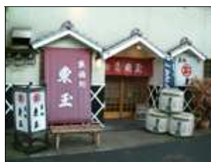
なまこかべ クラ 海鼠壁の蔵シックな店構え