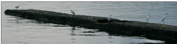
野島海岸に「おいしい」エサを求めて集まるサギの仲間たち (写真と本文とは関係ありません)

「オレオレ詐欺」「架空請求」「点検商法」などの被害が後を絶たないようですが、これらに加え、地震がきたら家がペチャンコになりますよとあって、でたらめな耐震補強をする「悪質リフォーム」や危険なアスベスト製品を除去しますよとあって、屋根工事などをする「アスベスト詐欺」など、新しい詐欺商法が増加しています。これらは、電話や訪問販売などによるもので、書面ではなく、口頭での契約で工事が行われることがほとんどで、時間を置かずに即日工事することが特徴となっています。電話や訪問販売するすべての業者が、そのような悪質な業者ではないでしょうが、トラブルに巻き込まれないためにも、今までに面識がなく、初対面にもかかわらず、不安感を掻き立てたり、期間限定のサービスを提案したりする業者については、日頃から警戒をした方がよさそうです。(第12号「蟻型迷惑」・第30号「錯覚」をご参照ください)