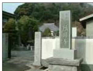
しんぼざんどうおんじ 深浦山獨園寺 臨済宗建長寺派 横須賀市浦郷町3-42 046(865)5604

合掌しましょう 父母に合掌すれば孝順となり 子供に合掌すれば慈悲となり 目上合掌すれば敬意となり お互いに合掌すれば平和となり 自己に合掌すれば修行となり 事物に合掌すれば感謝となり み仏に合掌すれば信心となる