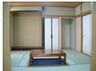
リフォームによってよみがえった床の間と掘りこたつのある居間

参考資料 財団法人住宅保証機構「住まいの移り変わりとこれからの住まい」 小学館 ビジュアルNIPPON「昭和の時代」