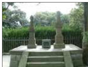
三浦按針夫妻の供養塔がある塚山公園の桜が見ごろを迎えます

不思議なことに、ウィリアム・アダムズが祖国の妻に当てた書簡などが、原作者のスウィフトの家から発見されました。筆記体で書くと「Xamoschi(ザモスキ)」と「Kannonsaki(カンノンサキ)」は、なんとなく似ている気がします。また、彼は2メートルを超す身長で、かつて領地があったあたりは現在「天空の街」と言われ、さらに、日本で結婚した奥さんは、馬込勘解由(まごめかげゆ)の娘と言われています。