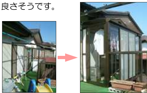
(立山アルミ・らんどりあⅡ)