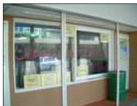
↑新ワイン醸造工場 ←喫茶(軽食)コーナー