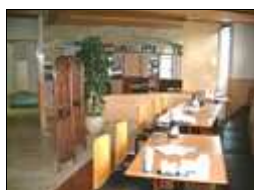
広々として落ち着いた雰囲気店内

美味しい空間、安心できる雰囲気の中で、日本文化と中国の大陸文化が奏でる卓越した味を堪能することができます。