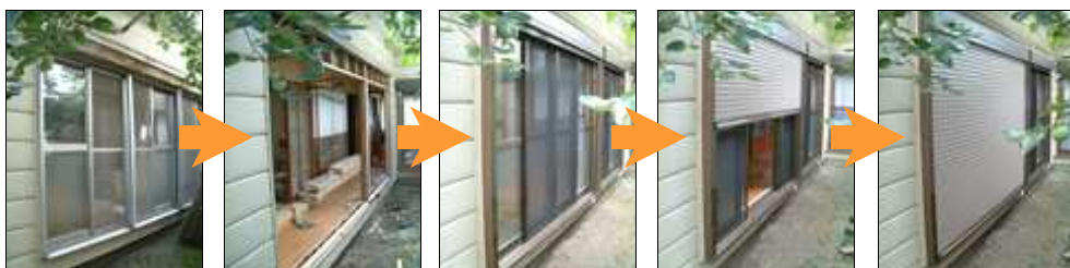
雨戸シャッターがサビついて重くなり開閉が困難になった。 → 雨戸シャッターとサッシを取り外し、シャッター部分の下地を一部補強した。 → 雨戸シャッターとサッシが一体化したものを取り付け、枠を補修した。 → 開閉がスムーズになり、片手で上げ下げができるようになった。 → おしまい。「閉店ガラガラ。ばあ。出たっ！」

今回のリフォームの内容は、鉄製の雨戸シャッターとサッシがサビと調整不良から、重たくなり開閉時に労力を要するようになったので、アルミ製の雨戸シャッター・サッシ一体型に交換するという工事です。「劇的な」リフォームではないかも知れませんが、ビフォー、アフター、さらにそのアフターまでお手伝いさせていただきます。