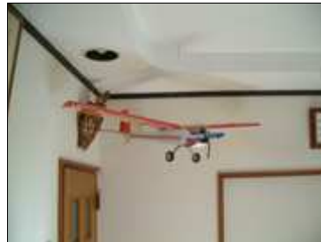
(↑) ディスプレイされたラジコン飛行機 (→) みんなが集う掘り炬燵のある落ち着いた雰囲気のと室