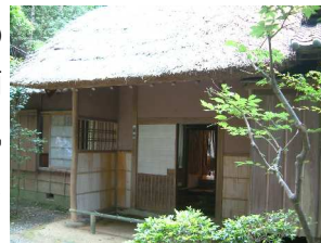
旧川合玉堂別邸 横浜市金沢区富岡東 5-19-22 お問い合わせ 金沢区政推進課

屋敷の中に2本の老松があったことから「二松庵」と名付けられたこの別邸で、「長閑」「紅白梅」「から臼」の作品が描かれたのではないかとされています。