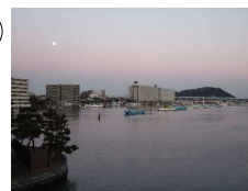
せとのしゅうげつ ②瀬戸秋月