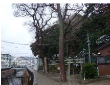
こずみのやう ①小泉夜雨