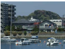
しょうみょうのばんしょう ⑤ 称名晩鐘