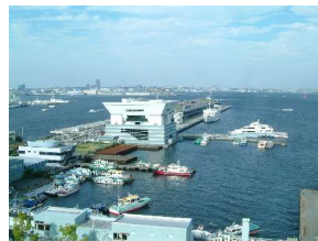
横浜港大さん橋国際客船ターミナル 「くじらのおなか」で、もしかしたら、ゼペット爺さんに会えるかも…。

その後の復旧工事を経て、平成14(2002)年に、横浜港大さん橋国際客船ターミナルとして、リニューアルオープンされました。個性的なデザインと斬新な構造の空間美を持っています。ターミナルは入場無料で、360°のパノラマが楽しめる屋上広場(くじらのせなか)は24時間オープンしています。施設内(くじらのおなか)は、エレベーターとスロープが整備され、階段のないバリアフリーとなっています。