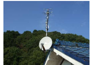
アンテナは電波状態が良い位置に移設した。

※2…携帯電話向け地上デジタル放送のことで、ワンセグメントの略。地上デジタル放送に割り当てられた電波の周波数帯域幅が13の領域（セグメント）に分割されています。そのうちの12を固定テレビ向けのハイビジョン放送に使い、残りの1つを携帯電話向けの動画放送に使っています。