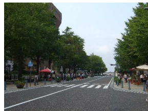
日本大通り スペシャルサイト

2006年から、通りに面して、カフェテラスがオープンしました。路上のライブやパフォーマンスなど、アートの香りがするお洒落なストリートです。