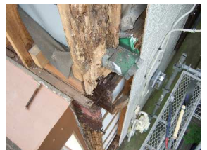
一部補修が必要となった外壁下地

「劇的な」リフォームではないかも知れませんが、ビフォー、アフター、さらにそのアフターまでお手伝いさせていただきます。