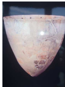
明治大学博物館 収蔵 尖底深鉢土器 底が尖った縄目模様のついた土器が出土した

夏島は、伊藤博文が明治憲法を起草した地でもあり、また、中腹に縦横に掘り巡らされた壕は、旧海軍の追浜飛行場の格納庫の役割も果たしていました。近代化遺産を活用した、歴史を生かした街づくりも進行中です。