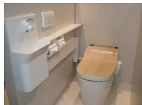
パナソニックリビングショールーム横浜に展示されている。

カウンタータイプ（自動水栓） 定価105,000円 (30%OFF) 73,500円（税込）