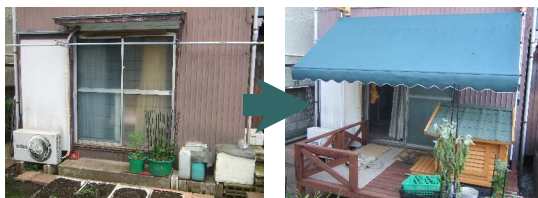
既存の土間との段差をデッキの柱で調整し、段差のない広いスペースを確保した

犬や猫などのペットを飼い、親友のように付き合っている高齢者ほど健康な傾向にあるといったデータがあるようです。犬や猫などをなでると血圧が下がるといったことも報告されているようです。動物との共生が健康を保つことに役立っているのかもしれませんが。