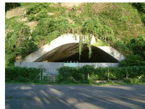
野島掩体壕 横浜市金沢区野島町

この掩体壕を建設した「横須賀海軍第300設営隊」は、横須賀海軍施設部第一部隊を改編した部隊で、海軍の将兵に技術者を加えた精鋭部隊でした。日吉台(横浜市港北区)の旧日本海軍連合艦隊司令部地下壕や松代大本営地下壕(長野県松代町)などの建設にも加わりました。これらはすべて戦争のために建設されたものですが、当時の土木技術の粋を集めた貴重な資料です。歴史的な遺産として保存し後世に伝えようとする動きが活発化してきました。