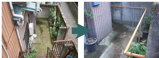
門扉から玄関まで、途切れることなく連結して、手すりを設置した

おまけに、これは介護保険制度の住宅改修の適用はありませんが、ベットのがある部屋の履き出し部分に、季節によって違う表情を見せる庭を眺めながら、太陽と風を楽しむことができるようなデッキを取り付け、犬小屋を設置して、ペットと和むスペースを設けました。ちなみに、このデッキと犬小屋はお施主様が「昔取った杵柄」でご自分で組み立てました。