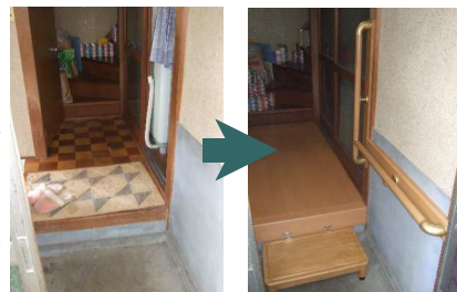
式台は新しく設置した玄関框に金物を固定した

今回は、介護保険制度を利用した住宅改修工事です。誰の助けを借りることなく、ひとりで買い物などの外出ができるように、玄関入口部分には、手すりと式台を設置し、玄関から道路までのアプローチ部分には、段差のあった敷石を取り除きフラットにして、既存のブロックを利用して、転倒を防止するために、手すりを設置しました。「安心して外出ができるようになりました」というご感想をいただきました。