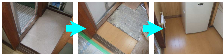
脱衣室の床は、風呂場の入り口付近が最も傷みが激しく、既存のクッションフロアを剥がしたあと、根太を補強して、下地を交換してから、新しいフローリングに張り替えたので、きしむ音はなくなった。

●ポイント● 脱衣室の床は、水が廻る可能性が高く、じめじめした状態が続くとシロアリによる被害が懸念されます。施工前に点検をしておくことをお勧めします。