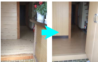
下駄箱から収容能力の高い玄関収納に交換した。

●ポイント● 玄関から各部屋を繋ぐ廊下は、巾を広く取れるように、なるべく不要なものは置かないようして、また、段差をなるべくなくすように、心がけたいものです。