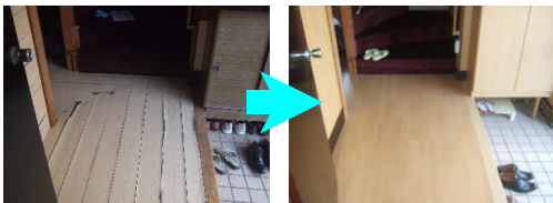
玄関の框の上から、フローリングの厚みに合わせて、リフォーム框を施工した。

「劇的な」リフォームではないかも知れませんが、ビフォー、アフター、さらにそのアフターまでお手伝いさせていただきます。