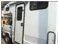
キャンピングカー

「劇的な」リフォームではないかも知れませんが、ピフォア、アフター、さらにそのアフターまでお手伝いさせていただきます。