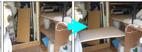
スペースを有効利用できるよう工夫した