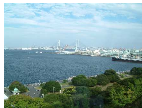
山下公園 横浜市中区山下町 みなとみらい線 元町・中華街駅より 徒歩3分