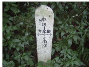
森戸川源流 葉山町

林道終点からさらに森戸川の源流を求めて歩く、主な上級コースは、南沢コース、中尾根コース、中沢（うなぎ淵沢）コースの3コースがあります。二子山や乳頭山を經由して、沼間、田浦方面へと続いています。清流や滝など自然を満喫できる中沢（うなぎ淵沢）コースは、かつて、大きなうなぎが棲んでいたという言い伝えのあるコースです。遭難しないように周辺の地図を用意してチャレンジしましょう。