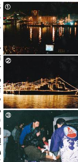
①② 艦船のイルミネーション ③ 海上自衛隊による甘酒のサービス