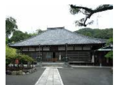
臨済宗義明山満昌寺

横須賀ゆかりの武士といえば、やはり三浦一族。桓武平氏流のこの一族が、文学作品のなかで最初に記述されるのは、平安時代末期の「後三年の役」(1083~87)を描いた『後三年合戦絵詞』のようで、「三浦の平太郎為次」として三浦為次(継)が登場します。源義家率いる政府軍の「聞こえ高き者(著名な武士)」としての参戦ですが、戦友の鎌倉権五郎景正が目を射られて倒れたので、顔を足で踏みながら矢を抜いてあげようとしたところ、「武士の顔を踏むな!」と激怒され、それで丁寧に抜いたというエピソードが語られるのみです。この三浦為次の2代後の三浦大介義明が『平家物語』に登場します。