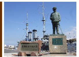
東郷平八郎（三笠公園）