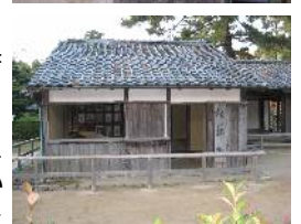
長州藩のシンボルである松下村塾