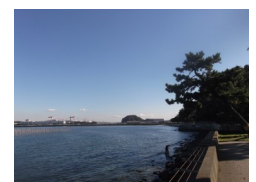
金沢別邸(野島)より夏島を望む

夏島は、大日本帝国憲法草案の集中的な検討会が開かれ、「夏島草案」がまとめられた地として知られていますが、その責任者であったのが伊藤博文(1841～1909)です。藩閥政権の中心で初代の内閣総理大臣であります。立憲政友会を組織し次代の政党政治の礎を用意した大政治家です。また彼は文雅の士でもあり、特に漢詩に秀でていますが、『伊藤公全集』には10首ほど短歌も載録されています。そのなかには「電気鉄道開業式の折」という詞書で「雲の上にきらめき渡る電も車引く世となりける哉」というユーモラスな短歌があります。電気鉄道は明治28年(1895)京都で初めて開業したので、その折の作と思われます。