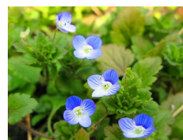
オオイヌノフグリ

第1句集『半生』(1979年)所収。風人子の代表作とされる句で、たとえば、『現代俳句大事典』(三省堂)の風人子の解説において、この句が挙げられているほか、『改訂版 ホトギス新歳時記』(三省堂)でも「犬ふぐり」の例句としてこの句が選ばれています。「犬ふぐり」とは早春に咲く瑠璃色の可憐な花。果実が犬の陰囊(いんのう。「ふぐり」ともいう)に似ているところからこう呼ばれています。道端や畑、山野など、句の通りどこにも咲きます。