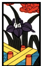
まさしく 今が 「しょうぶ」 とき

余談ですが、この場合、Cの冷静さは不可欠ですが、AとBは現在の状況に「もうダメだ」と絶望的にならずに希望を持ち続け、DはCに対して「オイッ、早くしろッ！何やってんだ！」と感情的にならずに、とりあえず、Cの答えが出るまでは、「沈黙」をもって協力をするのが大切です。つまり、自戒の念を込めて、「自分の見えている世界がすべてではない」と再認識して、ルールに従い、この局面をみんなで乗り切ることで、感謝の気持ち」を忘れずに、青い空の下、みんなで心置きなく楽しく暮らせるその日が来たあとも。