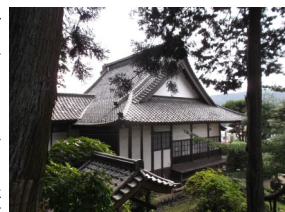
写真は上から 「烏川の河原」 「墓がある東善寺の本堂」