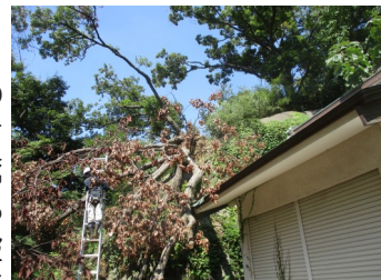
ナラ枯れの被害を受け、強風により根元から倒れたコナラ

この「ナラ枯れ」には、抜本的な対策がないのが現状です。カシノナガキクイムシの穿入を受けても、その樹木の持つ防御反応によりすべて枯死に至るわけではありませんが、被害が報告されると、ハイキングコースや人家に近い場所の倒木被害を防ぐため、やむを得ず、伐倒作業が進められています。