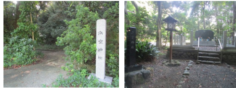
富岡総合公園内に創建された浜空神社

昭和11年11月、富岡（現富岡総合公園内）に横浜航空隊が開設され、飛行艇隊の守護神として昭和13年、「鳥船神社」が創建されました。戦後に至り、その功績と戦没者の慰霊を捧げる目的で、昭和56年6月「鳥船神社」跡地に「浜空神社」として、新たに戦没者並びに戦後物故者二千余柱の英霊をお祀りされました。