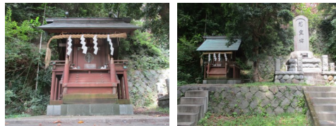
雷神社境内に遷座された浜空神社の社殿

その後、世話人の高齢化により社殿の維持が困難になったということで、追浜航空隊甲飛会のご尽力により、平成20年6月、社殿を富岡より追浜の地、雷神社に移し、追浜航空隊戦没者並びに物故者の英雄ともども永遠にお祀りされています。