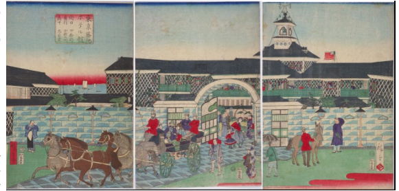
錦絵「東京築地ホテル館」（三代・歌川広重）