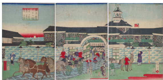
錦絵「東京築地ホテル館」（三代・歌川広重）